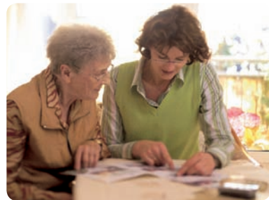
Wir sind für Sie da. Und das nicht nur dann, wenn Sie unsere Hilfe benötigen.