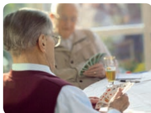
Ganz individuell: aktive Freizeitgestaltung im St. Pius-Stift.